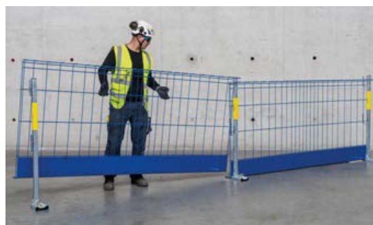
Rascher Aufbau durch wenige Teile