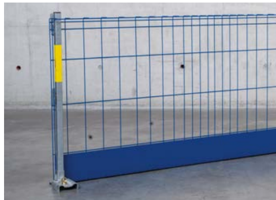
Einsetzbar mit dem bewährten Geländersteher XP 1,20 m